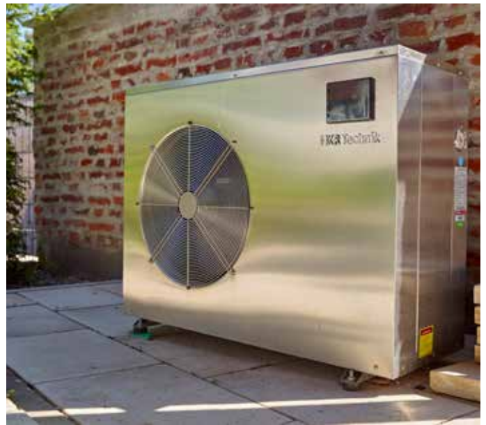
Eine Wärmepumpe gehört heute zum Standard, wenn es darum geht, das Schwimmbadwasser schnell, effizient und sparsam zu beheizen.

Zu einem funktionierenden Pool gehört ein tiptopp aufgeräumter Technikraum. Rechts: der große Filterkessel, an der Wand hängen Desinfektion, Mess- und Dosiertechnik sowie die Technik der Gegenstromanlage.