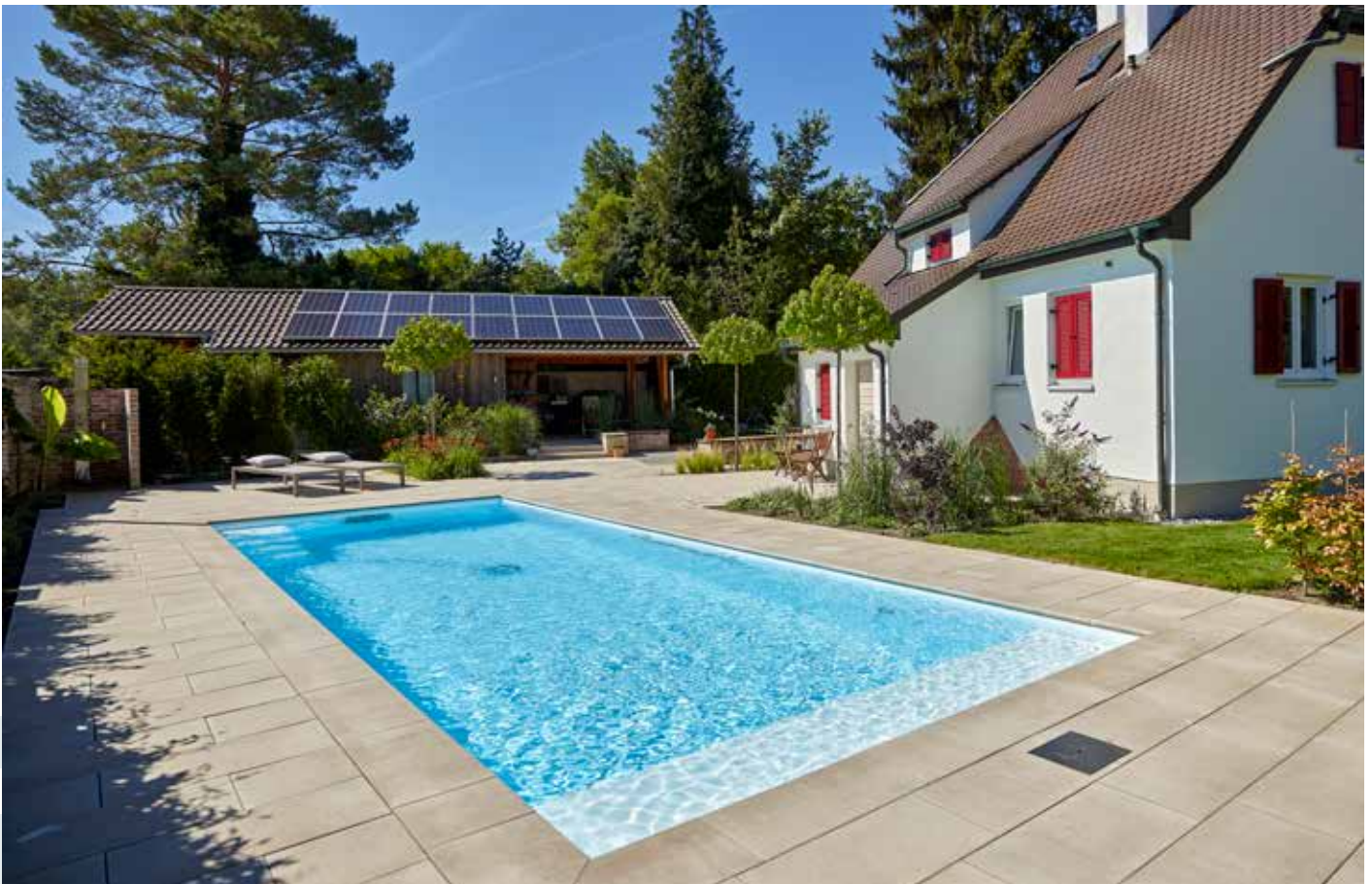
Eine Photovoltaikanlage auf dem Dach der großen Pergola unterstützt die Energiegewinnung von Haus und Pool. Die Farben des Beckens lassen das Wasser in der Sonne glitzern.

DIE BAUHERREN hegten den Wunsch, im Ruhestand für sich und die ganze Familie mehr Lebensqualität und ein ständiges Urlaubsgefühl ins Heim zu zaubern. Wichtig war ihnen dabei auch, dass sich der Neubau ihres neuen Pools harmonisch in die bestehende Gartenanlage einfügen sollte und zum architektonischen Stil und der Architektur des Hauses aus dem Jahre 1925 passt.